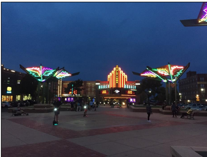
Wichita Downtown. Platz vor dem Kino in Oldtown .

einen Mitbewohner im Zimmer mit dem ich das Schlafzimmer, ein Badezimmer und den Einlege Raum teilte. Die Unterbringung auf dem Campus ist im Vergleich mit den Kosten von Wohnungen abseits des Campus zwar etwas höher jedoch hatte man in der Wohnung so schon eine voll eingerichtete Küche mit Wohnzimmer, sowie Waschmaschine und Trockner. Auch musste man einen sogenannten Essensplan dazu buchen. Dieser kostete mindestens 250$, welche man dann über das Semester benutzen konnte um damit Essen bei den Fastfood Läden auf dem Campus zu kaufen oder in die Mensa zu gehen, bei welcher man am Eingang je nach Uhrzeit Eintritt bezahlte und dann ein All-you-can-Eat Buffet hatte.