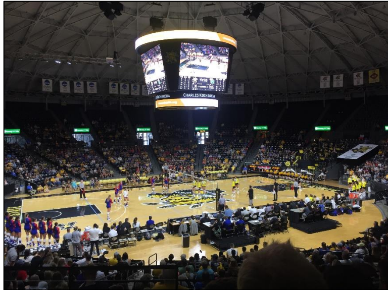
Charles Koch Arena von innen. Zu Semesterbeginn wurde hier Volleyball gespielt, am Ende des Semesters hauptsächlich Basketball

gehen, Kampfsport betreiben, das Fitnesscenter benutzen, verschiedenste Ballsportarten ausprobieren und vieles mehr. Am Ende meines Aufenthaltes wurde zudem ein zweites Sportgebäude neu eröffnet, das YMCA. Zusätzlich zu diesen Angeboten gibt es noch zahlreiche Tennis und Basketballplätze außerhalb.