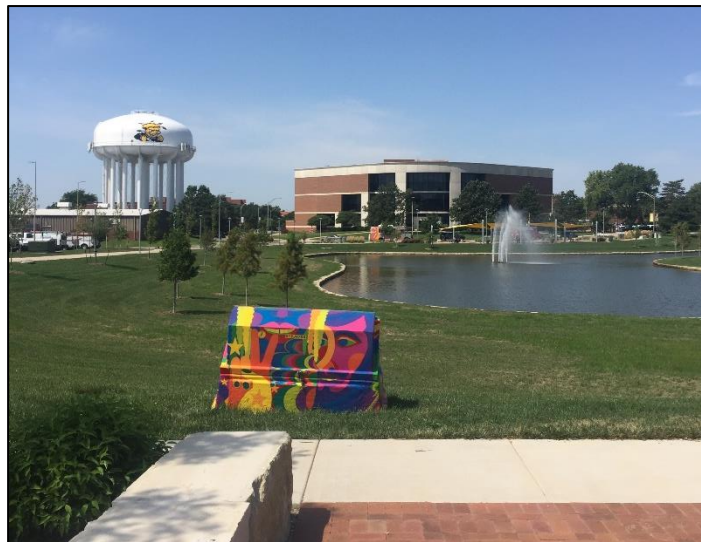
Kleiner See mit Fontäne auf dem Unigelände. Im Hintergrund sieht man den WSU Wassertank

Neben vielen anderen Gebäuden wie ein Theater, eine Arztpraxis oder auch ein großer Wassertank. Hat die WSU einige Grünbereiche und einen kleinen See zum runterkommen um Unialltag.