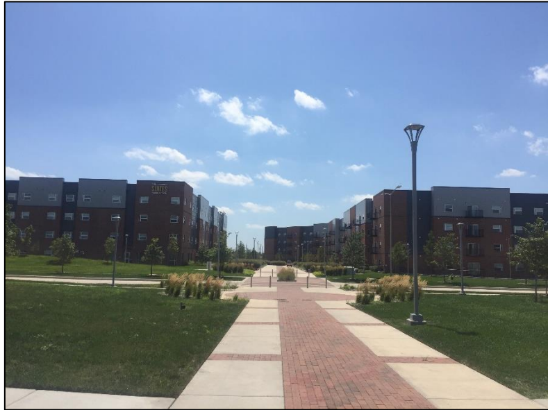
Blick auf die Wohnheime The Suites (links) und The Flats (rechts)

Als Austauschstudent entschied ich mich auf dem Campus zu wohnen, um möglichst schnell mit anderen Studenten in Kontakt zu kommen. Hierbei gab es drei Auswahlmöglichkeiten. Die Shocker Hall, die Flats oder die Suites. Da in der Shocker Hall meist nur Studenten aus dem ersten Semester wohnten und die Suites teurer sind als die Flats und nicht allzu viele Vorteile brachten, entschied ich mich für die Flats, die etwas abgelegener am östlichen Rand des Campus stehen. Die Flats sowie die Suites wurden erst vor einigen Jahren gebaut, wodurch beide Gebäude und die Umgebung noch sehr gepflegt und modern aussahen. Ich lebte in einer WG mit 4 anderen Amerikanern, dabei hatte ich