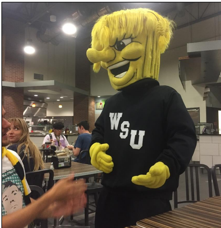
Maskottchen der WSU