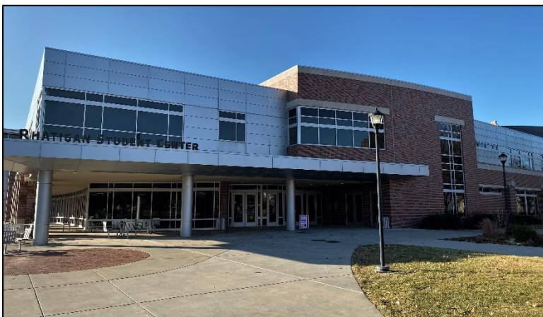
Eingang des Rhatigan Student Center

Neben Möglichkeiten sich Sport auf dem Campus anzugucken, gibt es auch viele Orte selbst Sport zu treiben. Während meines Aufenthaltes war das Heskett Center der erste Anlaufpunkt, wenn man allein oder in einer Gruppe Sport machen wollte. Hier konnte man Schwimmen