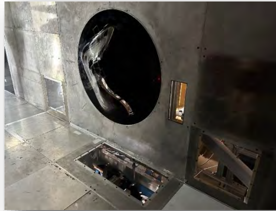
Abb. 9: Stability wind tunnel at VT

Für uns teilte sich die Exkursion in 3 Teile auf: Den Besuch des Corporate Research Centers an der VT mit Einblicken in einige Unternehmen/Startups, den universitären Windtunnel (stability wind tunnel) zusammen mit einer Trent 1000 engine facility an der VT, und eine Besichtigung der FEDEX facility am Flughafen Roanoke mit einer geführten Tour für die Frachtabfertigung an einer Boeing 757.