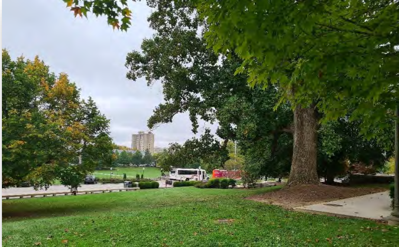
Abb. 3: Blick auf das Drillfield und Slusher Tower Hall