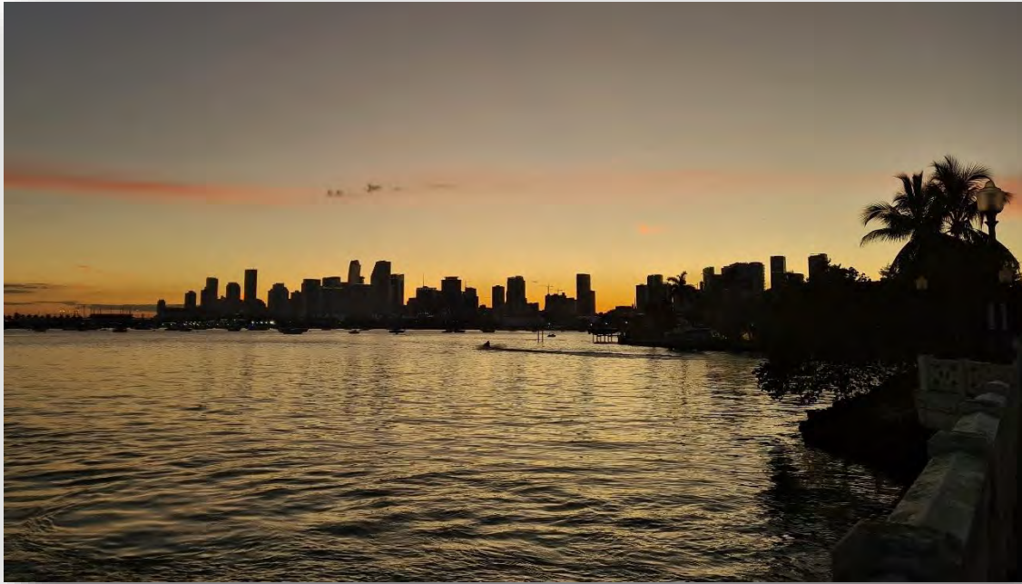
Abb. 13: Miami Downtown von den Venetian Islands

Ebenfalls kann man von Miami aus einen Raketenstart in Cape Canaveral live mitverfolgen. Ein unvergessliches Erlebnis für mich. Space X fliegt regelmäßig von hier aus, sodass sich die Möglichkeit durchaus ergeben könnte. Für Miami würde ich mindestens 5 Tage empfehlen und für jeden der damit ok ist Weihnachten und Silvester mal anders und bei Sonnenschein am Strand zu verbringen ein absolutes Muss. In meinem Fall hat mich mein Bruder besucht, sodass man nicht ganz allein war. Eventuell lassen sich aber auch Freunde von der VT für einen solchen Trip finden.