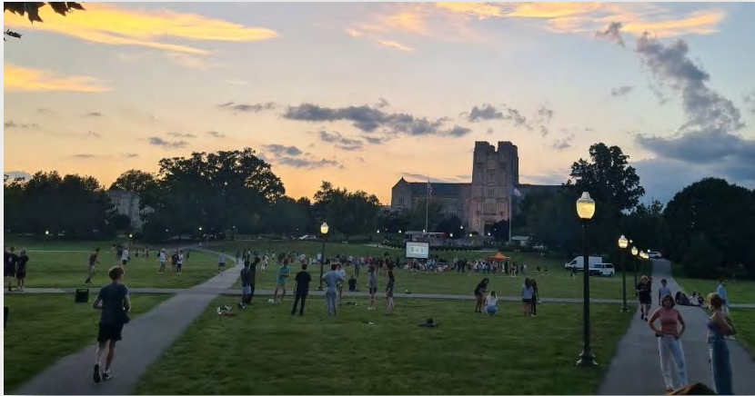
Abb. 1: Burruss Hall vom Drillfield

Allgemein empfehle ich allerdings ein Fahrrad, um sich sowohl auf dem Campus als auch in der Stadt fortzubewegen. Es gibt ein relativ einfaches und teilweise unzuverlässiges Bussystem, allerdings ist es hier typisch amerikanisch, sodass ohne Auto wenig geht. Deshalb empfiehlt es sich auch immer an Einheimische mit einem Auto zu halten und mit diesen größere Besorgungen, Ausflüge o.Ä. zu unternehmen.