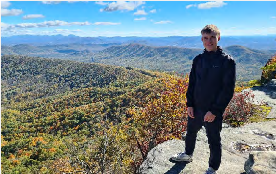
Abb. 7: McAfee Knob

Ein Muss in dieser Region ist das Wandern in den Appalachian Mountains (Teil davon Blue Ridge Mountains). Diverse Trails bieten sich an mit moderaten Wanderungen. Die VT liegt direkt an, quasi in diesen Bergen und. Ich persönlich habe es zeitlich „nur“ zu den Cascade Falls und dem McAfee Knob geschafft, es gibt jedoch auch noch weitere bekannte, lohnende Wanderungen wie Dragon's Tooth oder Tinker Cliffs.