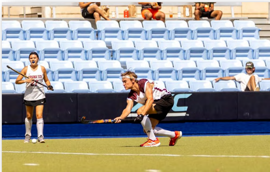
Abb. 6: Feldhockey als Clubsport

Natürlich kann man auch Joggen gehen oder das gut ausgestattete und völlig kostenlose Fitnessstudio mit angrenzendem Kleinschwimmbad besuchen. Zudem gibt es einen „Ballroom“ in dem man für kleines Geld Dart, Pool, oder Bowling spielen kann. Ich persönlich habe meinen Sport Feldhockey an der VT fortgesetzt und war sehr zufrieden damit. Die Leistung ist eventuell auf nicht ganz passendem Level, es geht aber auch mehr um die soziale Integration und den Spaß. Ich kann nur empfehlen sich einem Team anzuschließen und so gemeinsam auf Turniere zu fahren und „Socials“ an der VT zu erfahren. Freundschaften fürs Leben sind so für mich entstanden.