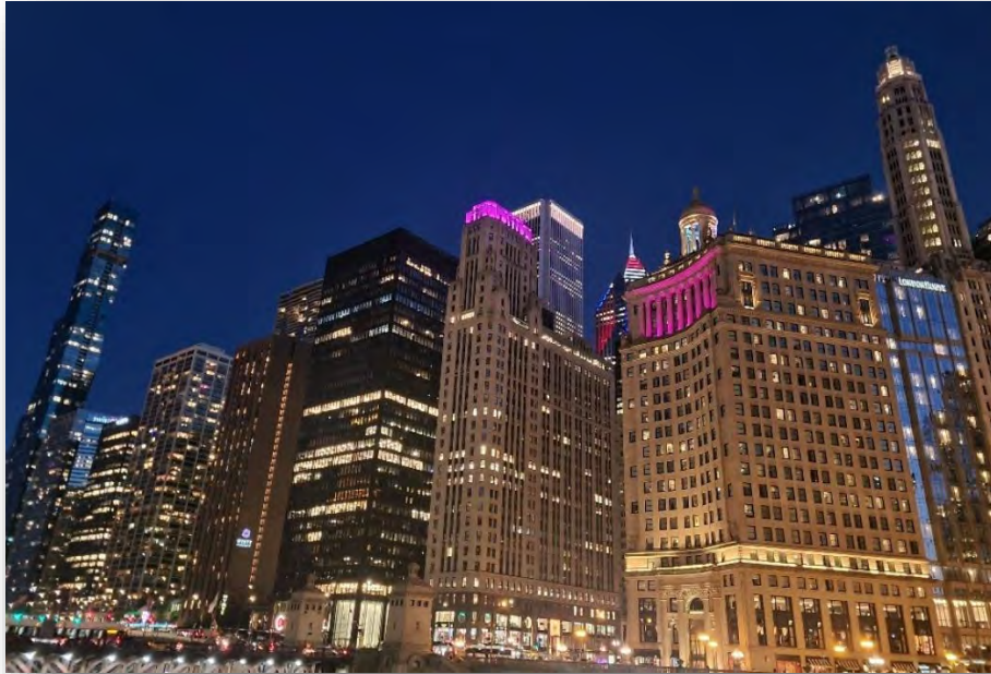
Abb. 12: Chicago, Blick vom Riverwalk

Eine wunderschöne Stadt. Kann ich nur empfehlen, wenn man es zeitlich irgendwie schafft. Ich war dort mit ein paar Freunden über ein verlängertes Wochenende. Von Christiansburg haben wir ein Auto gemietet, sind nach Charlotte gefahren und haben von dort einen günstigen Flug nach Chicago genommen.