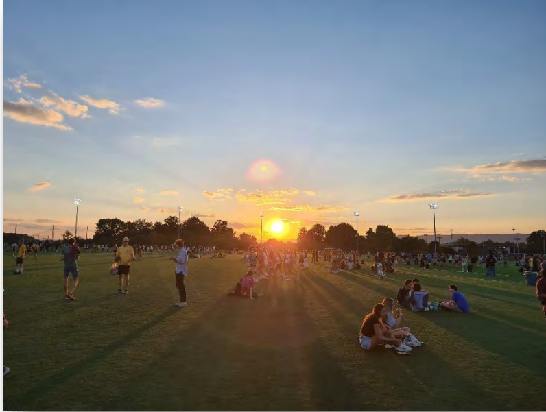
Abb. 5: Gobbler Fest / Rec Fest

Natürlich kann man auch Joggen gehen oder das gut ausgestattete und völlig kostenlose Fitnessstudio mit angrenzendem Kleinschwimmbad besuchen. Zudem gibt es einen „Ballroom“ in dem man für kleines Geld Dart, Pool, oder Bowling spielen kann. Ich persönlich habe meinen Sport Feldhockey an der VT fortgesetzt und war sehr zufrieden damit. Die Leistung ist eventuell auf nicht ganz passendem Level, es geht aber auch mehr um die soziale Integration und den Spaß. Ich kann nur empfehlen sich einem Team anzuschließen und so gemeinsam auf Turniere zu fahren und „Socials“ an der VT zu erfahren. Freundschaften fürs Leben sind so für mich entstanden.