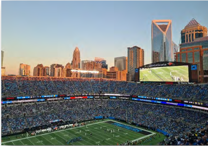
Abb. 14: Panthers; Bank of America Stadium