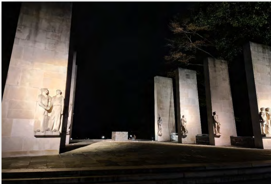
Abb. 2: War Memorial

Das bereits erwähnte Harry Potter Gefühl kommt durch den für die VT typischen und einzigartigen „Hokie-Stone“. Eben ein ganz eigener Charme der dadurch entsteht.