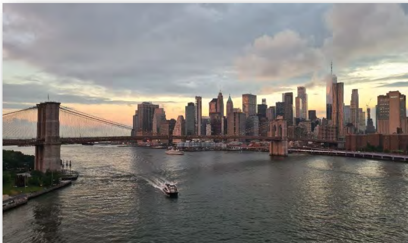
Abb. 10: NYC-Skyline

Ein Muss für mich aufgrund seiner relativ nahen Lage zur VT. Ich war vorher auch noch nie dort und kann die Stadt nur empfehlen. Ich bin in NYC in die USA eingereist und habe dort im August meine ersten 5 Tage verbracht, bevor ich per Zug (Amtrak) an die VT gefahren bin. Viele haben auch D.C. als dieses erste Ziel gewählt (ist etwas näher zur VT). Weniger als 5 Tage würde ich für NYC nicht empfehlen.