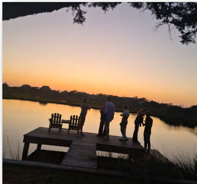
Abb. 15: Outer Banks, Seehaus

Meine größte Empfehlung für einen Trip mit Freunden an der VT. Outer Banks (OBX) liegt in North Carolina am Atlantik und ist ein sehr interessanter Küstenabschnitt, der sich relativ weit nach Süden runterzieht. Eine herrliche Landschaft und nette Gegend. Wir sind mit 2 Autos dorthin gefahren (ca. 7h) und haben zu 8 ein Haus über Airbnb gemietet. Kann ich genauso nur wärmstens empfehlen.