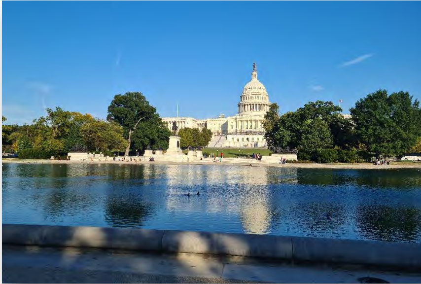
Abb. 11: Capitol in Washington DC

Wie bereits erwähnt, kann D.C. sehr gut per Zug von Roanoke aus erreicht werden. Eine gute Option für ein (verlängertes) Wochenende. Für mich waren 2-3 ganze Tage mehr als ausreichend. Auf jeden Fall ein Muss aufgrund der nahen Lage zur VT und seiner politischen Bedeutung.