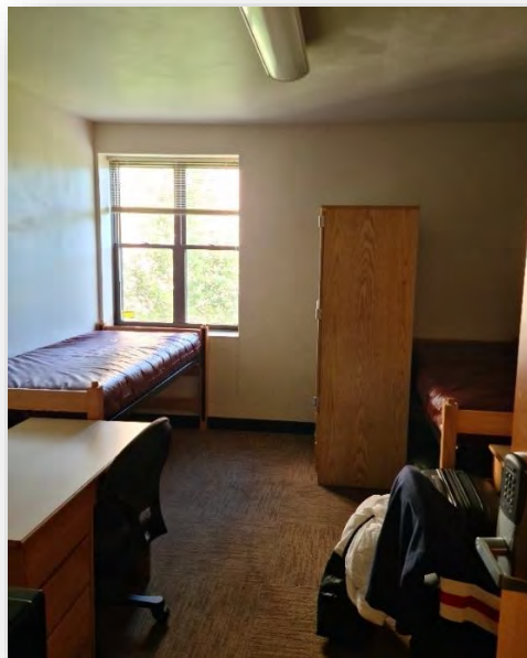
Abb. 4: Dorm Zimmer in West Ambler Johnston

Für die Unterkunft gibt es eigentlich 2 Möglichkeiten: On- oder Off-Campus. Letzteres ist etwas teurer und bringt mehr Aufwand mit sich. Man müsste sich vorher um ein Zimmer kümmern und kann dann auch nur 1-jahres Verträge schließen, wodurch man zum Ende hin das Zimmer wieder untervermieten müsste. Das ist allerdings möglich und einige Austauschstudenten wählen diese Option. Der Hauptvorteil ist, dass man ältere Studenten in solchen WGs kennenlernt und eine schönere Unterkunft erhält.