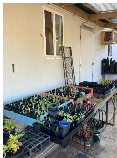
Pflanztag im Community-Garden