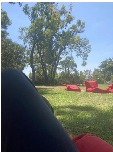
Der grüne Campus