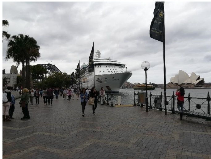
Abbildung 7: Circular Quay

Viele Ausflüge werden auch von Societies der Universität veranstaltet. Zum Beispiel nach Hunter Valley, der Wein Region in der Umgebung von Sydney, oder dem Royal National Park.