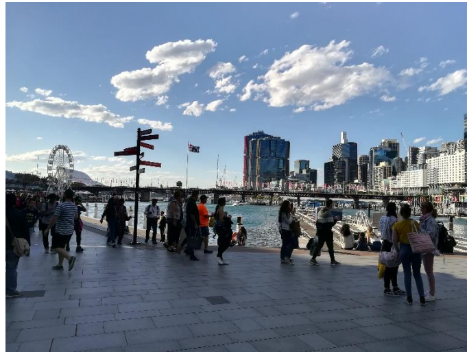
Abbildung 6: Darling Harbour

Hier gibt es eine allgemeine Tour und abends eine Tour durch „The Rocks“, die auch echt spannend ist. In dem Viertel gibt es vor allen Dingen viele Bars und Kneipen. Im Westen von Sydney gibt es die Blue Mountains mit vielen verschiedenen schönen Wanderwegen. Diese kann man auch mit der Bahn erreichen. Den Weg sollte man sich allerdings schon vorher überlegen, da davon die Haltestelle abhängt, an der man aus der Bahn aussteigt.