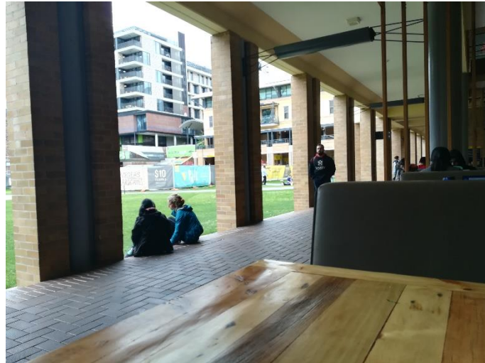
Abbildung 1: Sitzflächen Quadrangle Building

Tour in der Einführungswoche beginnt. Weiter geht es an Studentenwohnheimen und den verschiedenen Departments vorbei. Im Westen gibt es die „Village Green“, eine große Wiese für den Sport und das Roundhouse. Hier gibt es eine Bar und die Studentenausweise müssen dort auch abgeholt werden.