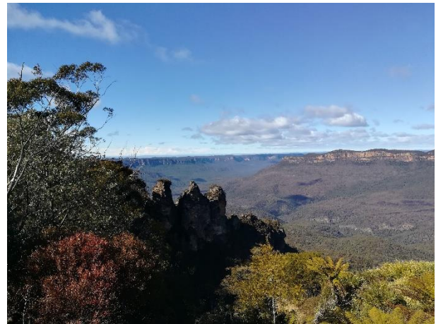
Abbildung 5: Blue Mountains

Mit der Fähre geht es von Circular Quay nach Manly, eine Halbinsel in Sydneys Norden mit einige Surfshops und einem schönen langen Strand.