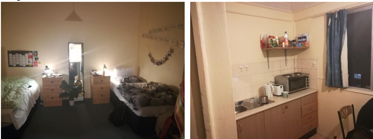
Abbildung 4: Zimmer mit Küche

Anschluss das Zimmer angeschaut und am Tag darauf, mich dazu entschlossen in dem Haus einzuziehen. Ansonsten gibt es eine große Auswahl an WGs zum Beispiel auf der Internetseite Flatmates. Die meisten haben sich die ersten Tage in einem Hostel einquartiert und in der Zeit einige Hausbesichtigungen organisiert. In meinem Haus haben viele internationale Austauschstudenten und Praktikanten gewohnt. Es war schön relativ alt, aber man hatten einen super Blick auf die Küste von Coogee, einen Fußweg von 30-40 Minuten zur Uni und nette Mitbewohner, mit denen man auch einiges zusammen machen kann. Ich habe mir ein Zimmer und eine Küche zu zweit