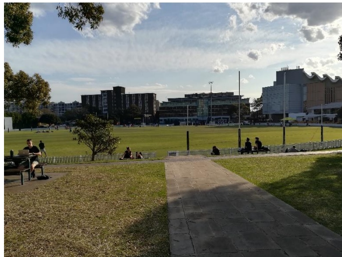
Abbildung 2: Village Green