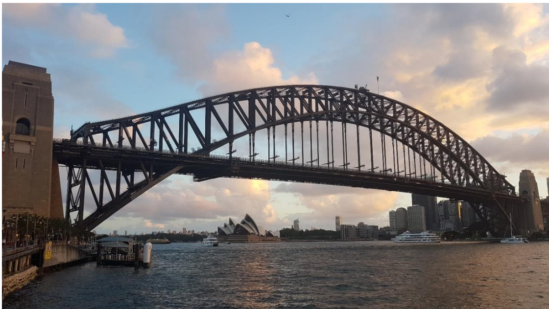
Abbildung 3: Harbour Bridge mit Opera House im Hintergrund

Sydney selbst ist eine Stadt, die aufgrund ihrer Größe viel zu bieten hat. Die berühmtesten Sehenswürdigkeiten sind das Opera House und die Harbour Bridge. Andere Sehenswürdigkeiten befinden sich im Central Business District (CBD) um Circular Quay, Darling Harbour und China Town. Zu empfehlen ist auch der Bondi-Coogee Coastal Walk, Blue Mountains und der Royal National Park.