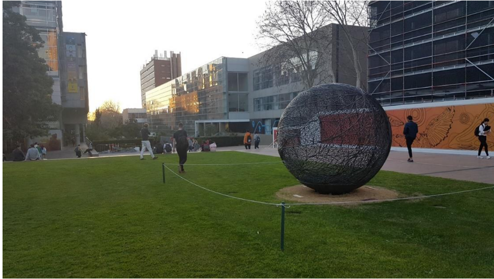
Abbildung 1: Globe Lawn am Ende des Main Walkways

Auf dem Campus ist auch eine Arztpraxis vorhanden. Bei akuten Beschwerden sollte man sich morgens telefonisch oder persönlich melden. Meistens wird man zuerst von einer Krankenschwester untersucht, die einen ggf. zu einem General Practitioner (vergleichbar mit einem Hausarzt) weiterleitet. Möchte man einen regulären Termin vereinbaren, ist dies mit einer längeren Wartezeit von mehreren Tagen oder Wochen verbunden. In der näheren Umgebung gibt es auch ein Krankenhaus, hiermit habe ich jedoch keine Erfahrungen gemacht. Die Behandlungskosten werden von der OSHC-Versicherung (z.B. Medibank) übernommen. Eine Medibank-Filiale ist auf dem Campus vorhanden. Kosten für Medikamente werden kostenabhängig erstattet (man kriegt eher bei sehr hohen Preisen einen kleinen Teil erstattet). Eine Apotheke ist auf dem Campus auch vorhanden.