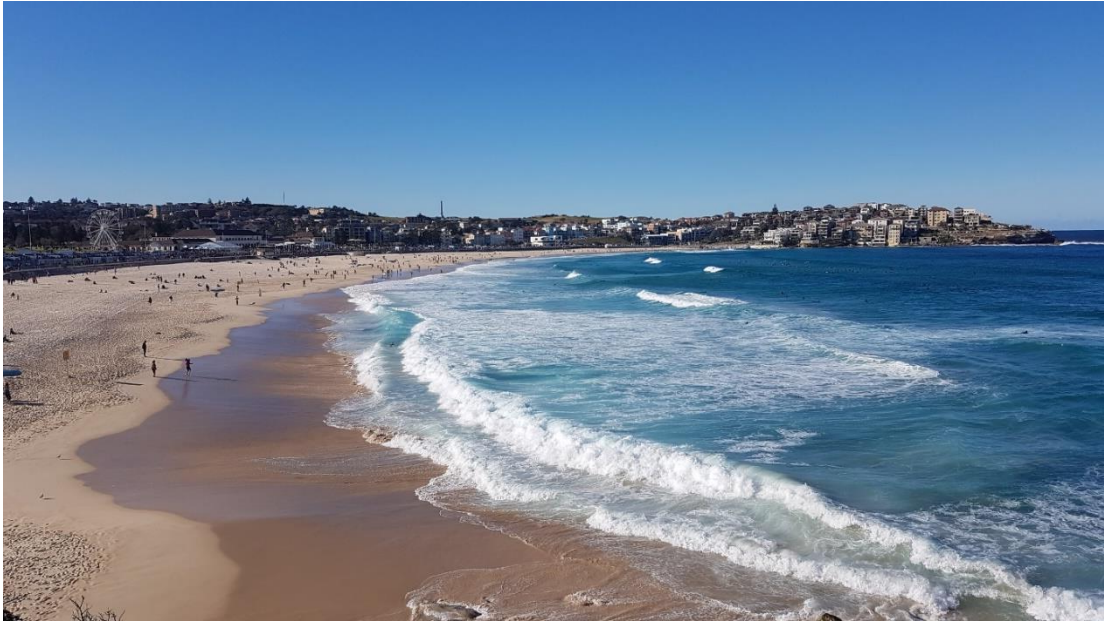
Abbildung 4: Bondi Beach

Wenn man in Australien ist, sollte man unbedingt das Land erkunden. Die Natur ist einzigartig und nicht vergleichbar mit dem, was man in Europa kennt. Zu empfehlen ist die Ostküste, vor allem zwischen Cairns und die Region um Brisbane. Die Great Ocean Road sollte in Kombination mit Melbourne bereist werden. Das Outback-Ziel im Red Center um Alice Springs (Uluru/ Ayers Rock) ist vergleichsweise teurer.