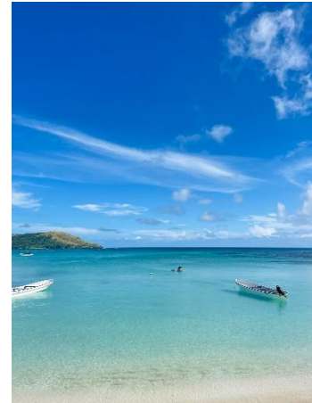
Fiji Sonnenuntergänge und kristallklares Wasser

Darüber hinaus erwies sich die Reise an der Ostküste Australiens an der Seite meiner Schwester und meines Schwagers als eine bereichernde Odyssee, bei der wir vielfältige Landschaften, pulsierende Städte und ikonische Wahrzeichen kennen lernten. Von der pulsierenden Metropole Sydney bis zum entspannten Küstencharme von Byron Bay bot jedes Reiseziel einen einzigartigen Einblick in das kulturelle Gefüge Australiens. Zu den Höhepunkten unserer Reise gehörten das Schnorcheln im Great Barrier Reef, die Erkundung des üppigen Hinterlands von Queensland und die majestätische Schönheit der Whitsunday Islands.