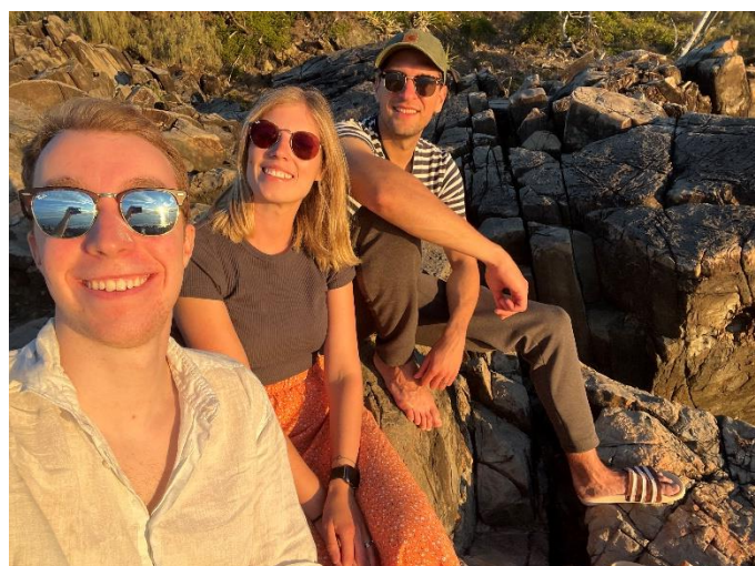
Sonnenaufgang auf den Whitsunday Islands und Sonnenuntergang in Noosa