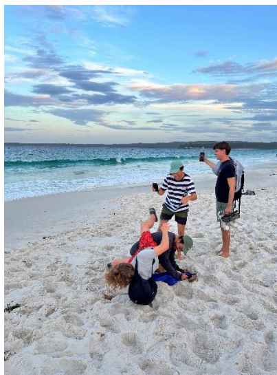
Ein bisschen Spaß muss sein in Jervis Bay

Über die Grenzen des Klassenzimmers hinaus war mein Auslandssemester von einer Vielzahl unvergesslicher Erfahrungen geprägt, die den Geist der Erkundung, des Abenteuers und des Eintauchens in eine andere Kultur verkörpern. Ein besonderer Höhepunkt war ein Wochenendausflug nach Jervis Bay, einem unberührten Küstenparadies, das für sein kristallklares Wasser, seine goldenen Strände und sein reiches Meeresleben bekannt ist. Gemeinsam mit Freunden aus verschiedenen Kulturkreisen begaben wir uns auf einen Roadtrip, bei dem wir die malerischen Küstenstraßen überquerten und die atemberaubenden Ausblicke genossen. Unser gemeinsames Abenteuer förderte tiefe Freundschaften und Kameradschaft, über geografische Grenzen und kulturelle Unterschiede hinweg.