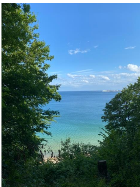
-Den Permanente Strand