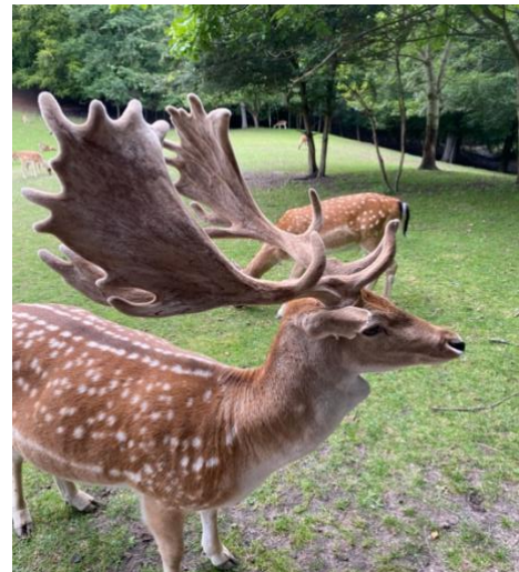
-Marselisborg Deer Park