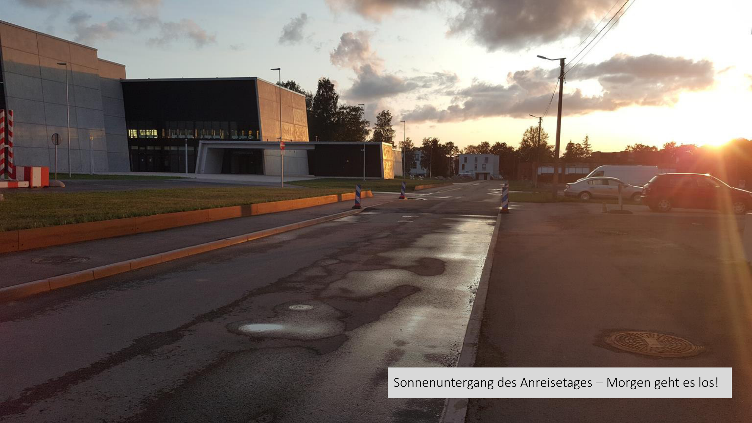
Sonnenuntergang des Anreisetages – Morgen geht es los!