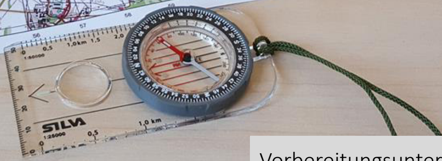
Vorbereitungsunterricht für den Orientierungsmarsch.