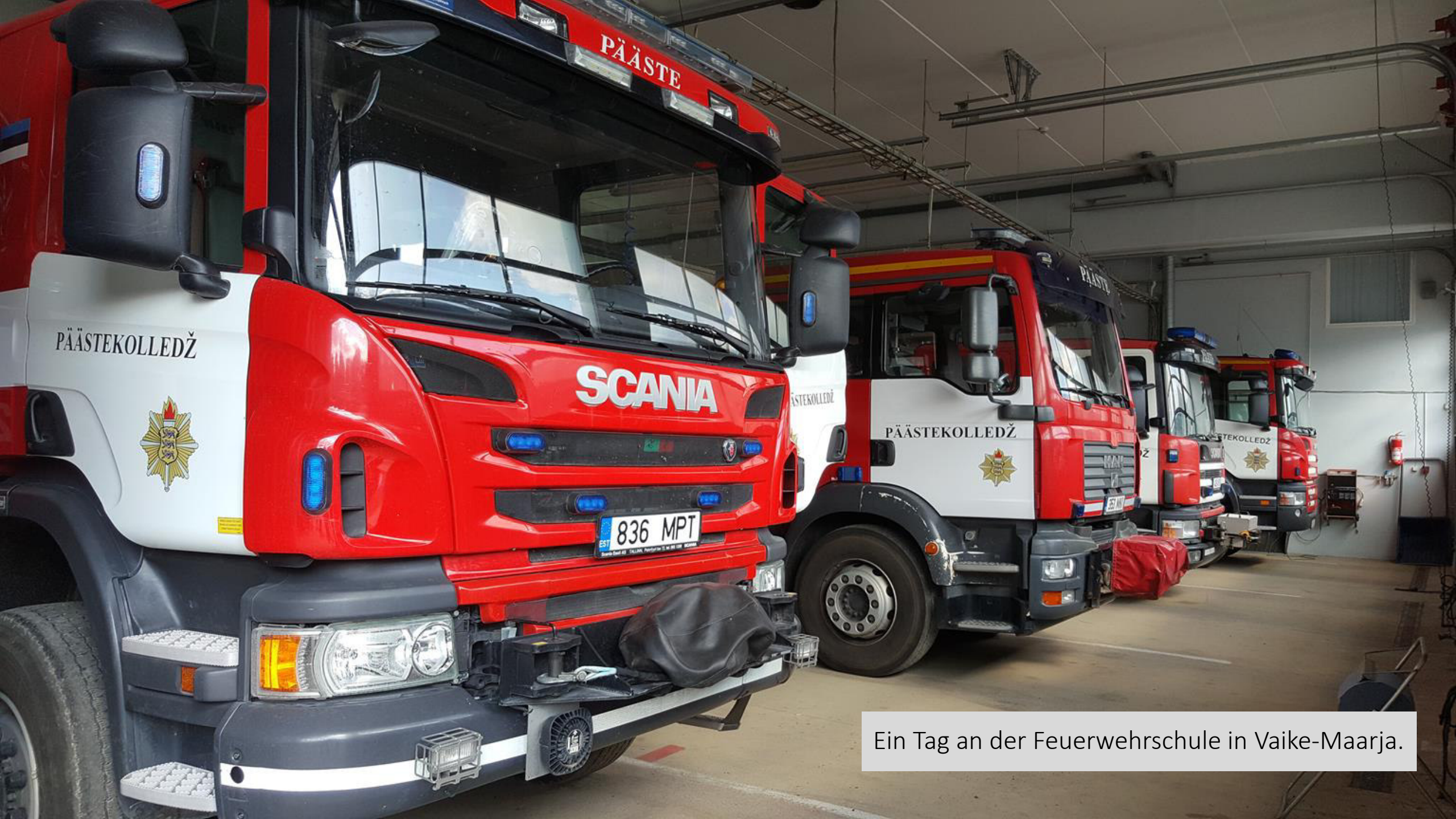
Ein Tag an der Feuerweherschule in Vaike-Maarja.