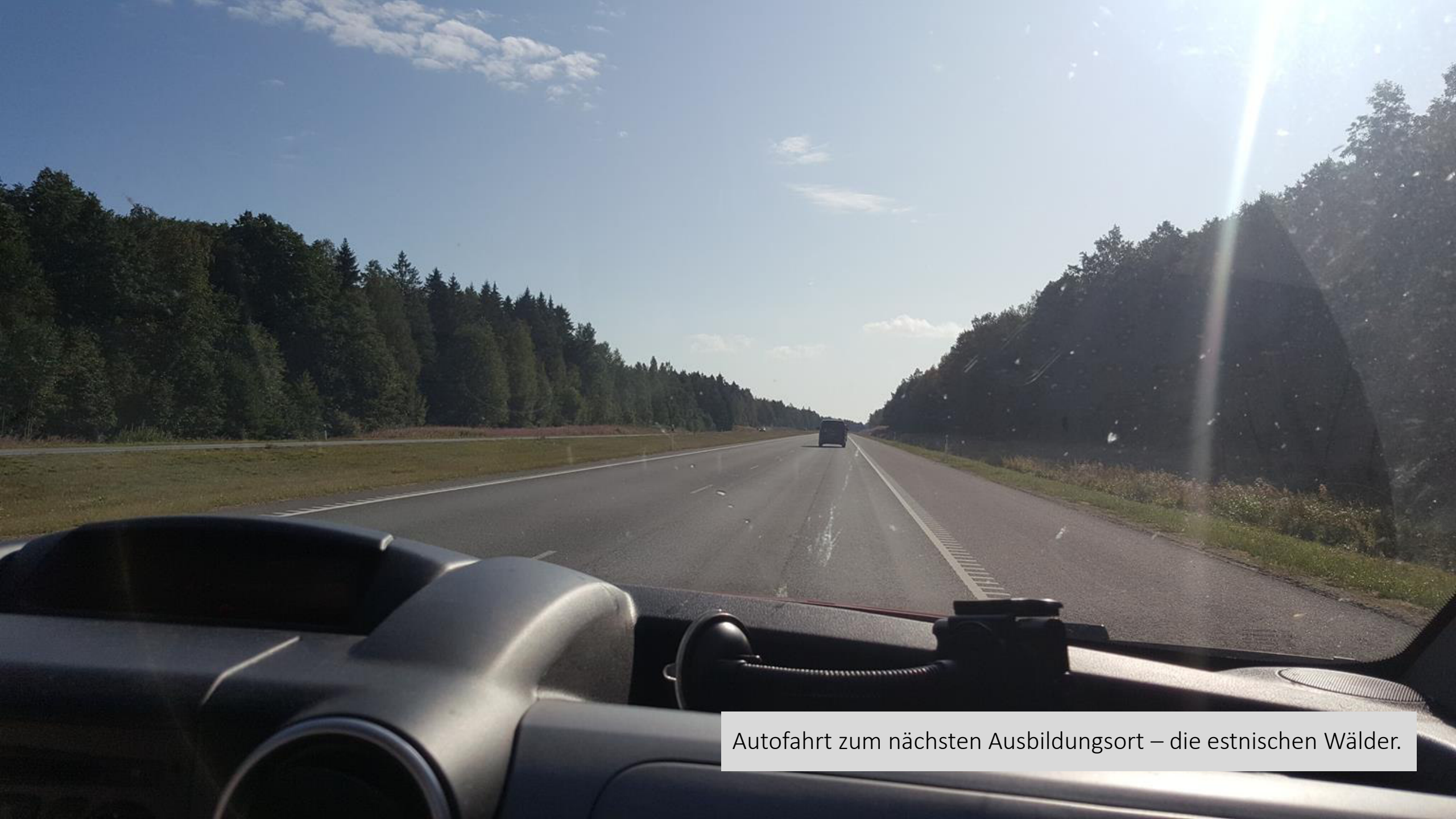
Autofahrt zum nächsten Ausbildungsort – die estnischen Wälder.