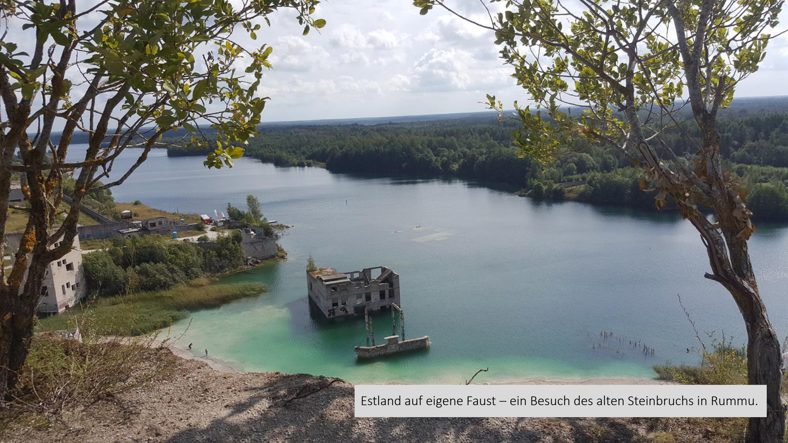
Estland auf eigene Faust – ein Besuch des alten Steinbruchs in Rummu.