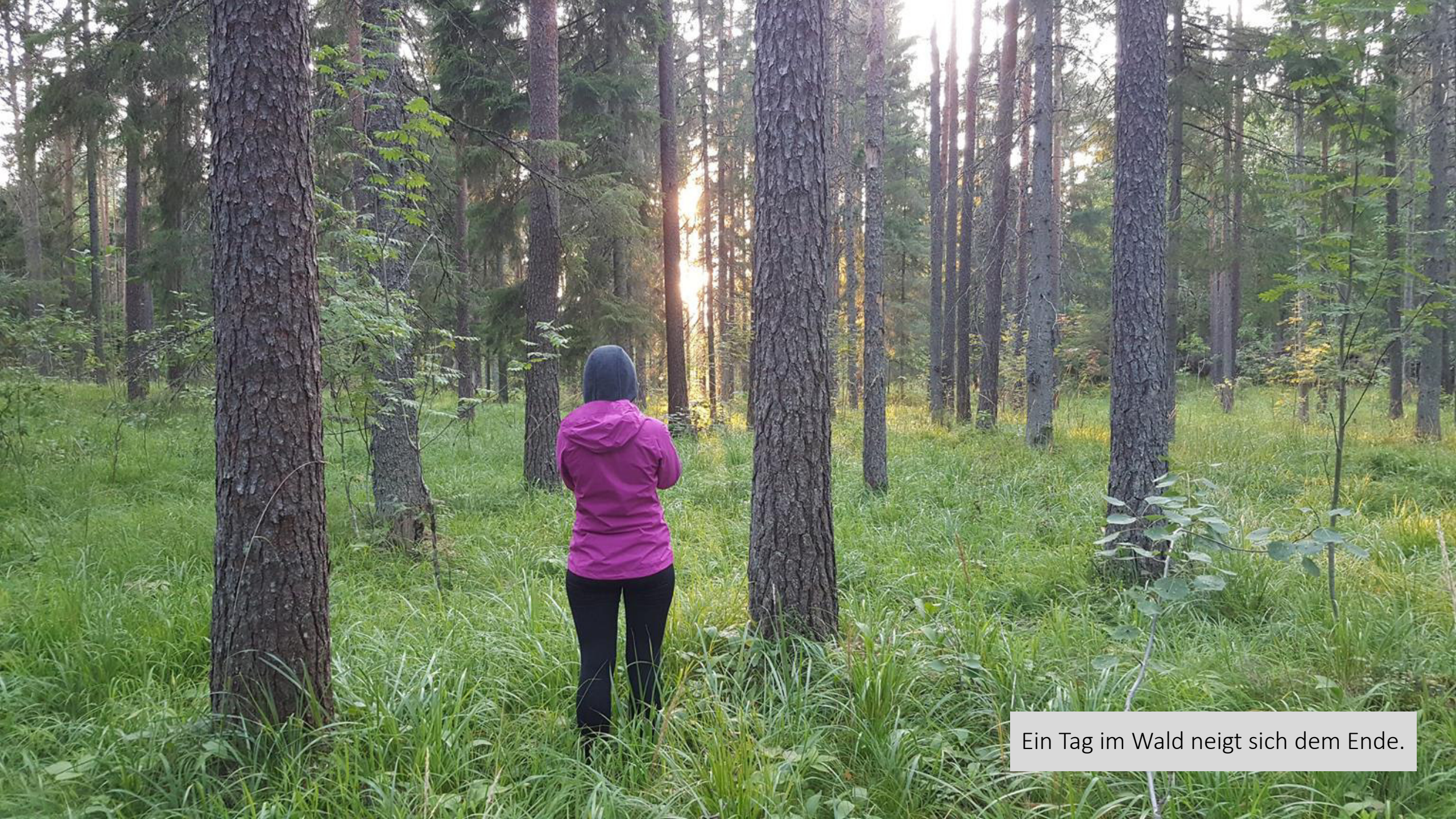
Ein Tag im Wald neigt sich dem Ende.