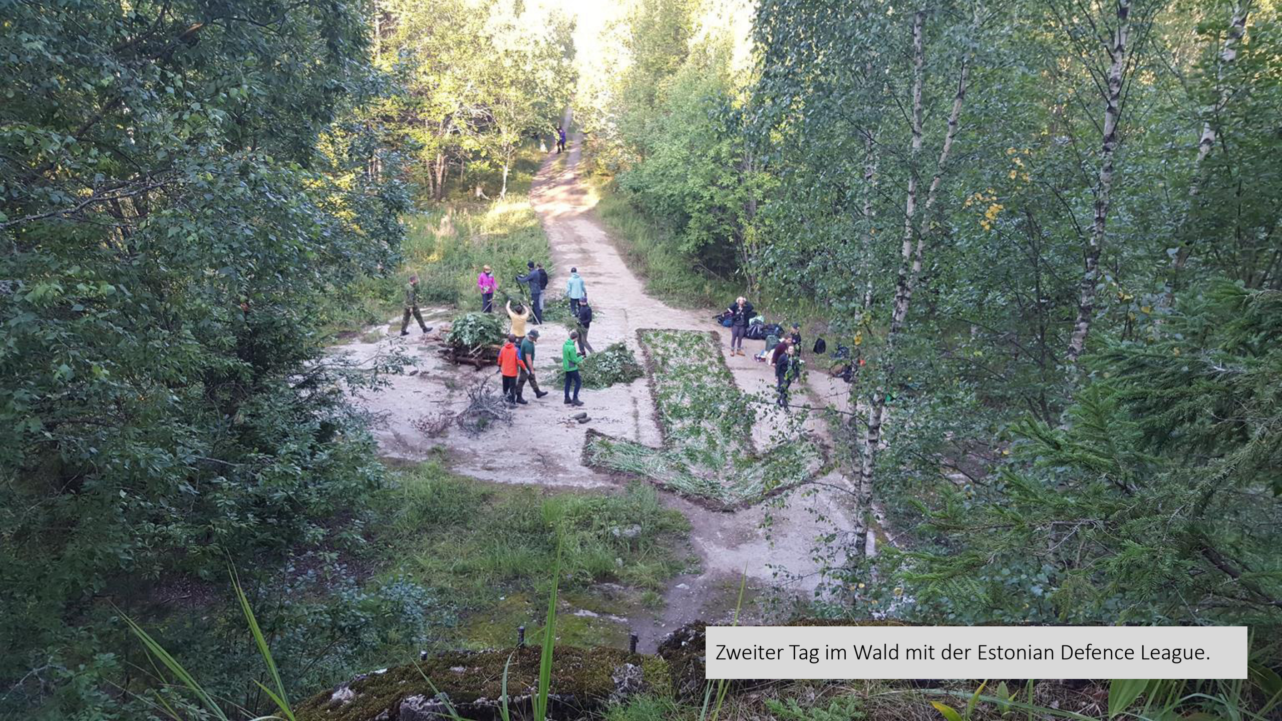
Zweiter Tag im Wald mit der Estonian Defence League.