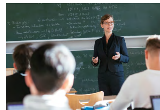
Dualer Studiengang Public Management der Fakultät Wirtschaft und Soziales