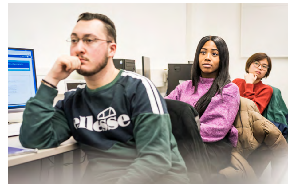
Die HAW Hamburg ist ein Ort der Vielfalt

Mit den Werten Chancengerechtigkeit, Antidiskriminierung und Wertschätzung als Kompass navigiert die HAW Hamburg die Herausforderungen um Bildungsgerechtigkeit, Kompetenzentwicklung und die Lösung komplexer, gesellschaftlicher Probleme. Die Umsetzung dieser Diversity-Vision gelingt der Hochschule, wenn die Handlungsziele prozessual und strukturell nachhaltig verankert sind, u.a. im Qualitätsmanagement. Mit zentralen und dezentralen Diversity-Ansprechstellen und -Zuständigkeiten ist die Hochschule handlungsfähig. Eine dialogorientierte Steuerungsstruktur für Diversity (Diversity-Monitoring) in Verzahnung mit dem Gleichstellungsmonitoring flankiert die Ansprechstellen.