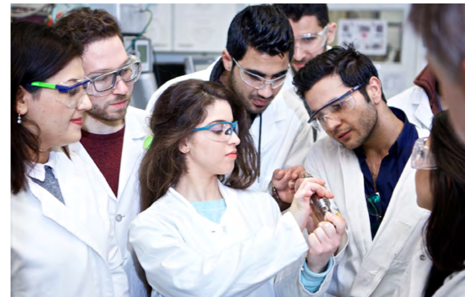
Studierende in einem Labor der Fakultät Life Sciences auf dem Campus Bergedorf

Am Beispiel des digitalen Wandels, der mit tiefgreifenden Veränderungen aller Lebensbereiche und der Arbeitswelt einhergeht, führt die HAW Hamburg Debatten nicht nur zu technologischen und wirtschaftlichen Folgen, sondern auch zu gesellschaftlichen Aspekten der Digitalisierung in einer Gesellschaft großer Vielfalt. Hier fokussiert sie unter anderem Fragen zu Solidargemeinschaft und Zusammenhalt sowie gesellschaftlicher Teilhabe im digitalen Wandel, digitalen Öffentlichkeit und Nachhaltigkeit (s. Digitalisierung ). Ein breiter Dialog mit der Öffentlichkeit zu Digitalisierungsfragen und weiteren gesellschaftlichen Herausforderungen und Themen hat einen hohen Stellenwert für die gesellschaftliche Mitgestaltung, schafft Vertrauen und fördert die Akzeptanz in der Gesellschaft.