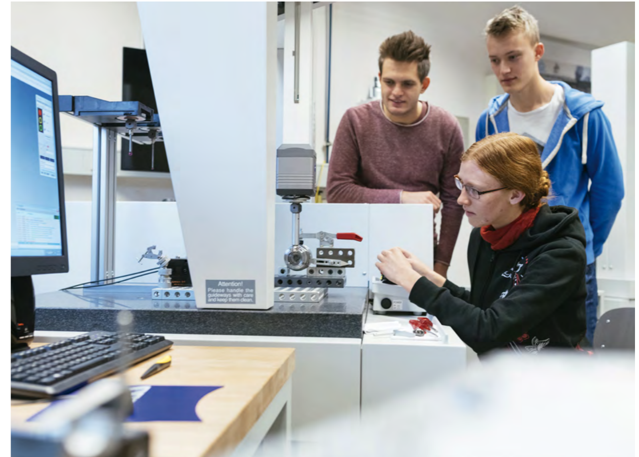
Der Bachelor-Studiengang Maschinenbau (Fertigungstechnik) ist ein gemeinsamer Studiengang der HAW Hamburg und der University of Shanghai for Science and Technology (USST)