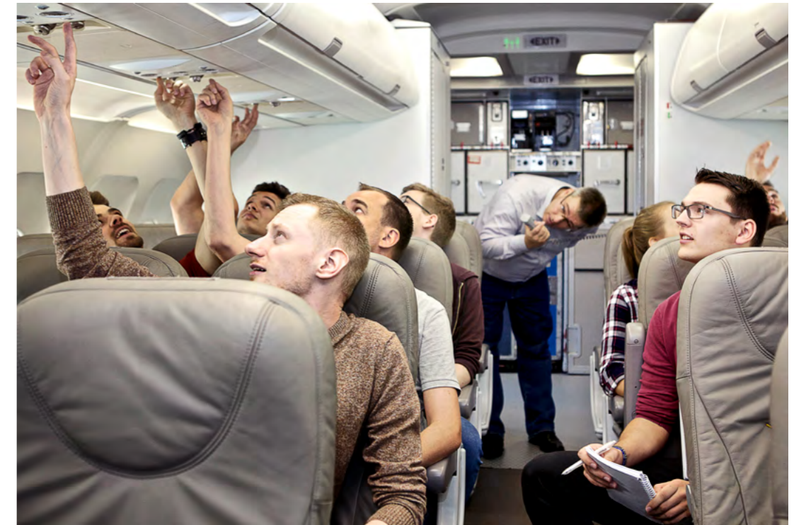
Der Studiengang Flugzeugbau an der Fakultät Technik und Informatik ist auch im dualen Studium möglich

Die Corona-Pandemie veranlasst die HAW Hamburg ihre zuvor gesetzten Ziele in Studium und Lehre noch einmal zu reflektieren. Im Ergebnis will sie nach wie vor neben den regulären Studiengängen gezielt duale Studiengänge ausbauen, um die Durchlässigkeit zum Studium (bspw. für beruflich Qualifizierte oder Personen, die als Erste einer Familie studieren) zu erhöhen und die Akademisierung insbesondere in der Gesundheitsbranche zu fördern. Sie hat Rahmenbedingungen für qualitätsgesicherte und zukunftsgerichtete Kooperationen mit Praxispartner*innen beschlossen. Die Fakultät Wirtschaft und Soziales ist hier Vorreiterin und bietet bereits sehr erfolgreich zwei duale BA-Studiengänge an, ein dritter ist zum Wintersemester 2020/2021 gestartet. An der Fakultät Technik und Informatik werden zehn BA-Studiengänge in dualer Studienform sowie seit 2020 ein dualer BA-Studiengang angeboten. An der Fakultät Life Sciences wird ein BA-Studiengang in dualer Form angeboten. Departments in allen Fakultäten planen weitere duale Studienangebote.