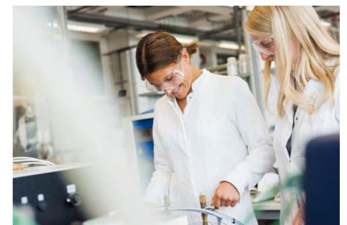
Dualer Studiengang Verfahrenstechnik an der Fakultät Life Sciences