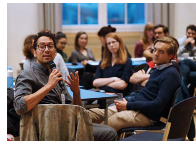
CARPE-Konferenz 2017 an der HAW Hamburg mit über 180 Forscher*innen aus zahlreichen europäischen Ländern

Weitere starke Partnerschaften in neuen Regionen sollen aufgebaut werden. Hierzu zählen insbesondere Brasilien und weitere Länder Südamerikas, perspektivisch auch wissenschaftliche Einrichtungen in Afrika.